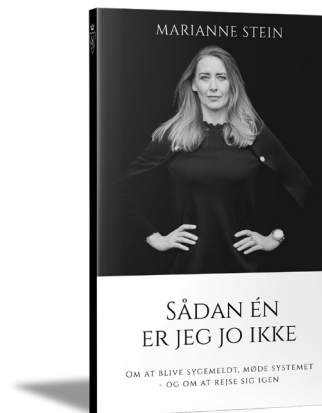
Forlaget Stein, 2020. 304 sider. 299 kr. www.mariannestein.dk

Resten af bogen er struktureret efter en LEDERSKAB-model med ni etaper: Lovgivning, Ejerskab, Dialog, Egenskaber, Rådgivning, Status, Kontakter, Action og Bisidder/